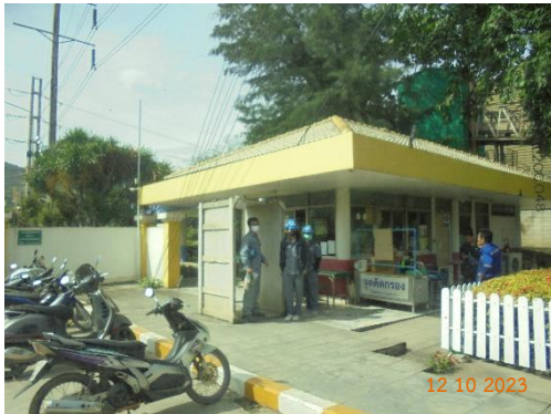
รูปที่ 2-21 อาคารติดต่อและรับเรื่องราวร้องทุกข์ ของบริษัทฯ

ของบริษัท ทีพีโอ โพลีน จำกัด (มหาชน) ระหว่างเดือนกรกฎาคม-ธันวาคม พ.ศ. 2566