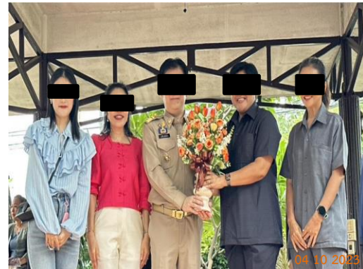
รูปที่ 2-22 สนับสนุนกิจกรรมชุมชน