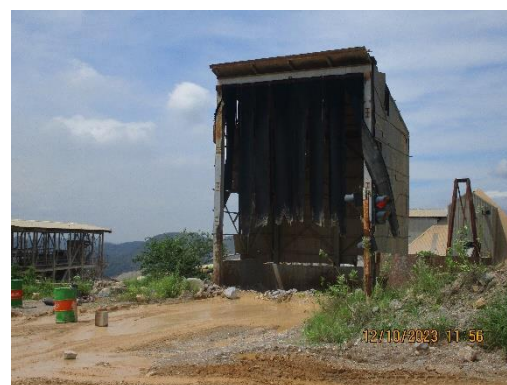
รูปที่ 2-28 เครื่องย่อยหินปูน (Limestone Crusher)