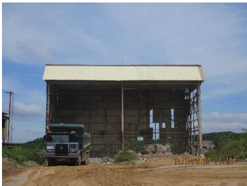
รูปที่ 2-31 เครื่องฉีดพ่นน้ำในลักษณะของม่านน้ำ บริเวณลานกองวัตถุดิบ