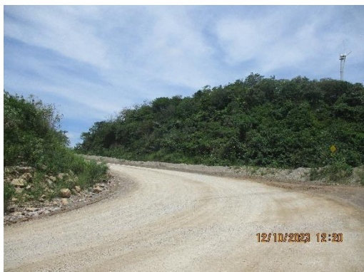
รูปที่ 2-23 ใช้ประโยชน์มูลดินในการปรับปรุง ไหล่ทาง และเส้นทางบริเวณหน้าเหมือง