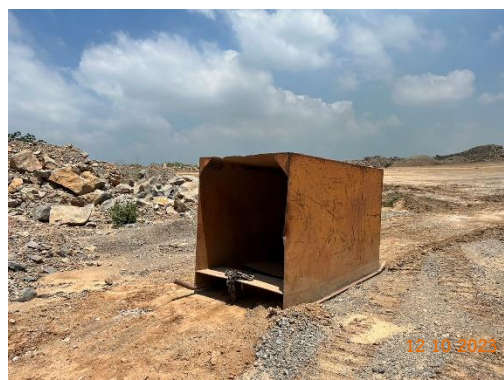
รูปที่ 2-5 ที่กำบังในการหลบขณะระเบิด