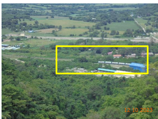
รูปที่ 2-8 ขอบเขตสุดท้ายของหน้าเหมือง ห่างจากเส้นทางรถไฟสายตะวันออกเฉียงเหนือ