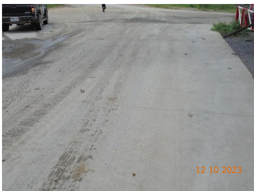
รูปที่ 2-33 ถนนคอนกรีตเสริมเหล็ก บริเวณเส้นทางขนส่งหลัก