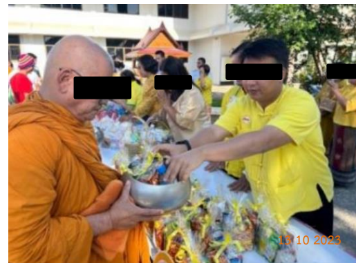
รูปที่ 2-22 (ต่อ) สนับสนุนกิจกรรมชุมชน