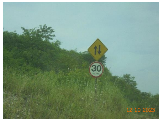
รูปที่ 2-24 ป้ายควบคุมความเร็ว บริเวณพื้นที่โครงการ