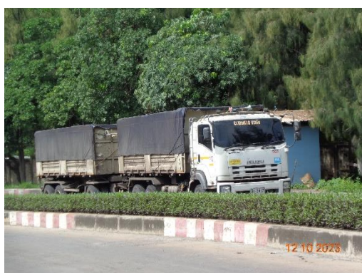
รูปที่ 2-13 ผ้าใบปิดคลุมรถขณะขนส่งแร่