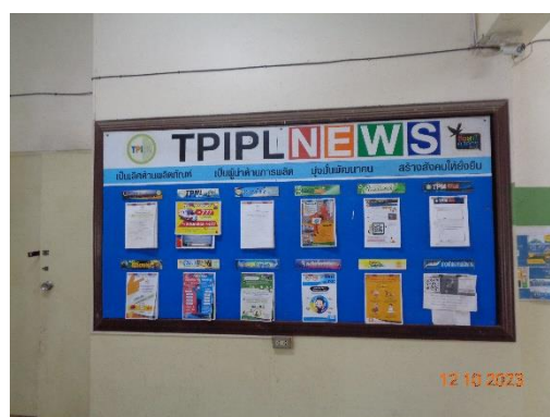
รูปที่ 2-19 ประกาศข่าวสารในพื้นที่เหมือง