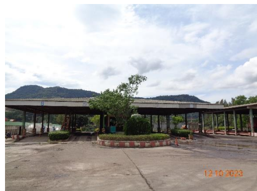
รูปที่ 2-34 เครื่องชั่งน้ำหนัก บริเวณประตูที่ 3