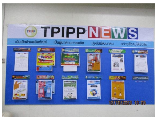
รูปที่ 2-43 บอร์ดประชาสัมพันธ์ แสดงเกี่ยวกับข้อมูลโครงการ