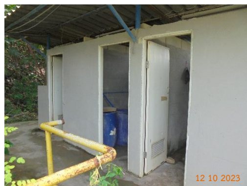
รูปที่ 2-17 ห้องน้ำภายในบริเวณโครงการ