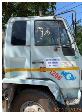
รูปที่ 2-39 เบอร์โทรศัพท์ หรือรายละเอียด ที่สามารถแจ้งข้อร้องเรียนที่เห็นชัดเจน ข้างรถบรรทุกแรงแห่งโครงการ