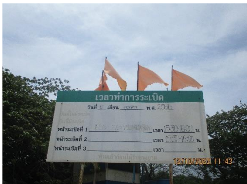
รูปที่ 2-6 ป้ายแจ้งวัน-เวลาระเบิด

ของบริษัท ทีพีโอ โพลีน จำกัด (มหาชน) ระหว่างเดือนกรกฎาคม-ธันวาคม พ.ศ. 2566