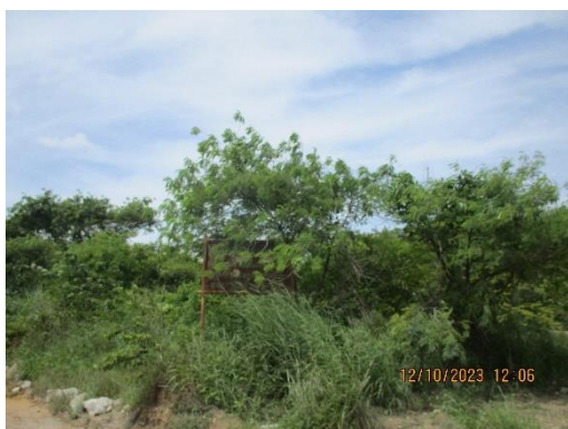
รูปที่ 2-25 โครงการปลูกต้นไม้เพิ่มเติม เพื่อฟื้นฟูพื้นที่ทำเหมือง