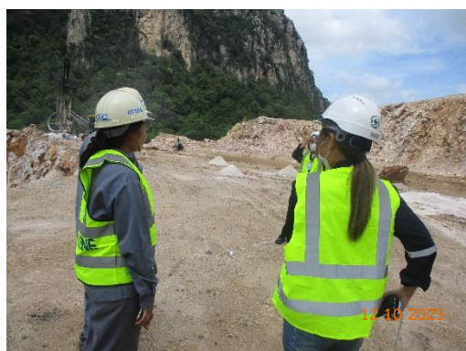
รูปที่ 2-27 การติดตามตรวจสอบตามมาตรการ ป้องกันและแก้ไขผลกระทบสิ่งแวดล้อม