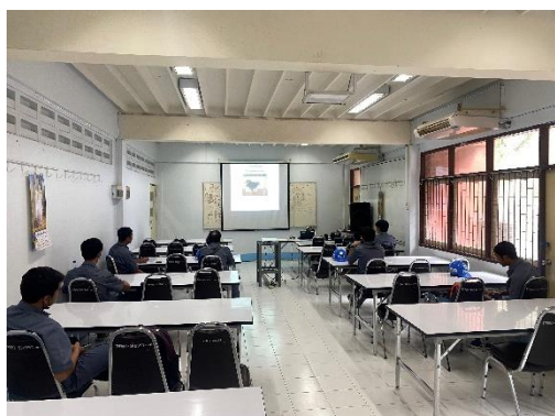
รูปที่ 2-41 การอบรมพนักงานขับรถบรรทุกแร่

ของบริษัท ทีพีโอ โพลีน จำกัด (มหาชน) ระหว่างเดือนกรกฎาคม-ธันวาคม พ.ศ. 2566