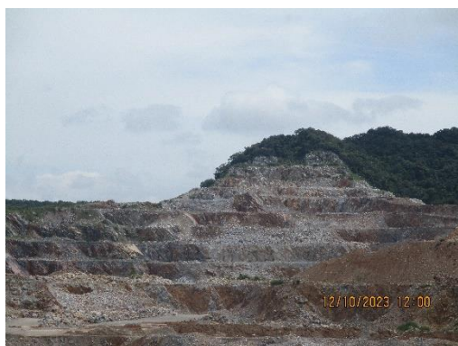
รูปที่ 2-2 ลักษณะการทำเหมืองแบบขั้นบันได เหมืองแร่หินปูน