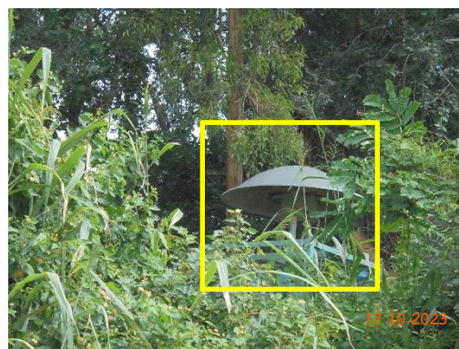
รูปที่ 2-3 สัญญาณเตือนก่อนทำการระเบิด