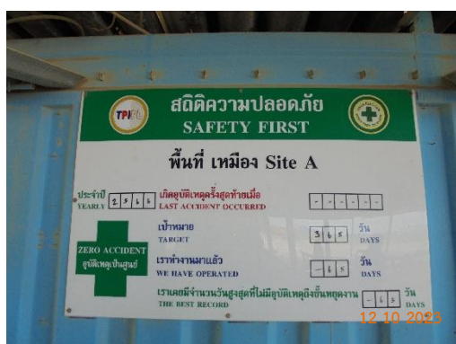
รูปที่ 2-18 ประกาศด้านความปลอดภัย ในพื้นที่เหมือง