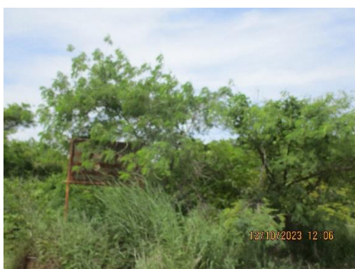
รูปที่ 2-10 โครงการฟื้นฟูเหมือง (ในแนวเขตเว้นการทำเหมือง)