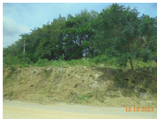
รูปที่ 2-26 ปลูกต้นไม้เพิ่มเติม บริเวณที่เว้นการทำเหมือง