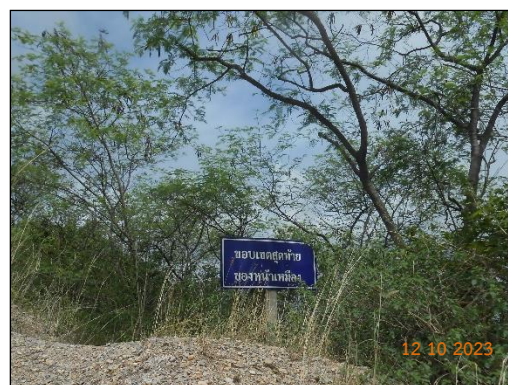
รูปที่ 2-7 ป้ายแสดงแนวขอบเขตการทำเหมือง