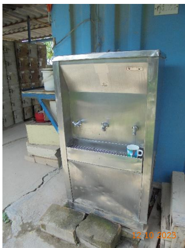
รูปที่ 2-16 ถังสำรองน้ำดื่มในพื้นที่สำนักงาน

ของบริษัท ทีพีโอ โพลิน จำกัด (มหาชน) ระหว่างเดือนกรกฎาคม-ธันวาคม พ.ศ. 2566