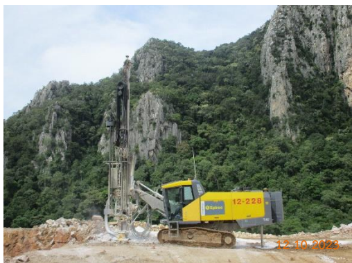
รูปที่ 2-11 เครื่องเจาะรูระเบิด ที่มีระบบ Cyclone และถุงกรอง

ของบริษัท ทีพีโอ โพลีน จำกัด (มหาชน) ระหว่างเดือนกรกฎาคม-ธันวาคม พ.ศ. 2566