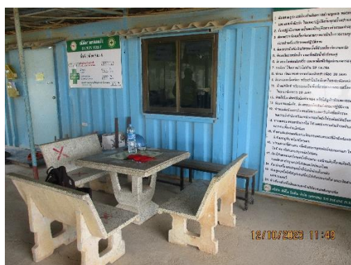
รูปที่ 2-20 บริเวณพักผ่อนสำหรับพนักงาน