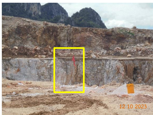
รูปที่ 2-4 ธงแสดงตำแหน่งหลุมเจาะ