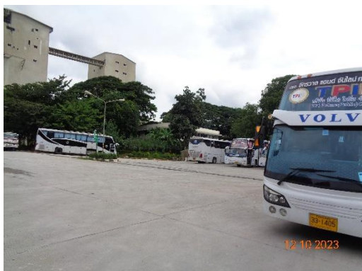
รูปที่ 2-35 ลานจอดรถบรรทุก บริเวณโรงงานปูนซีเมนต์

ของบริษัท ทีพีโอ โพลีน จำกัด (มหาชน) ระหว่างเดือนกรกฎาคม-ธันวาคม พ.ศ. 2566