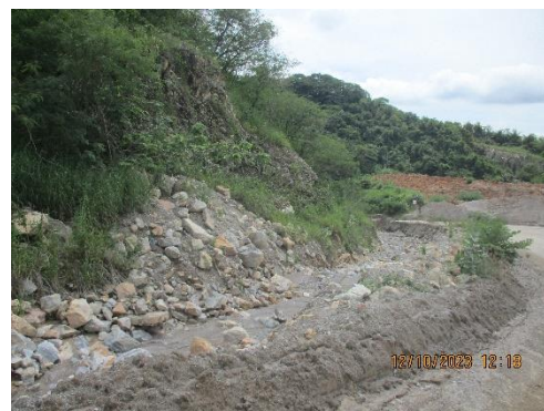
รูปที่ 2-40 คูระบายน้ำ บริเวณพื้นที่โครงการ