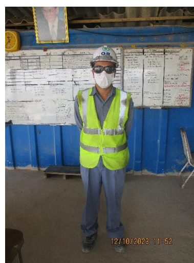
รูปที่ 2-14 การสวมใส่อุปกรณ์ป้องกันอันตราย ส่วนบุคคลของพนักงาน