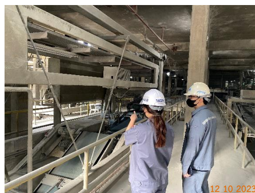
รูปที่ 2-38 การอบรมวิธีการทำงาน ของเครื่องจักรกลและอุปกรณ์แต่ละประเภท ให้แก่พนักงาน