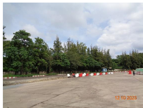
รูปที่ 2-42 ถนนคอนกรีต บริเวณพื้นที่โครงการ