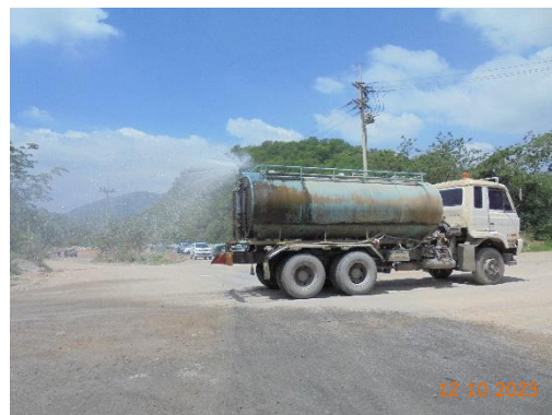
รูปที่ 2-12 การฉีดพรมน้ำบริเวณเส้นทางขนส่งแร่