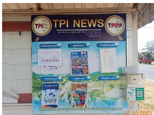
รูปที่ 2-37 การประชาสัมพันธ์ข้อมูลเกี่ยวกับ การดำเนินงานของโครงการ บริเวณชุมชนใกล้เคียง และหน่วยงานสาธารณสุขในพื้นที่