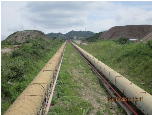
รูปที่ 2-29 ระบบ Bag Filter จุดถ่ายโอนต่างๆของสายพานลำเลียง

ของบริษัท ทีพีโอ โพลีน จำกัด (มหาชน) ระหว่างเดือนกรกฎาคม-ธันวาคม พ.ศ. 2566