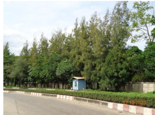
รูปที่ 2-30 ปลุกไม้ยืนต้นขนาดใหญ่ บริเวณขอบเขตพื้นที่โครงการที่ต่อเนื่องกับ โรงเรียนบ้านจับบอน