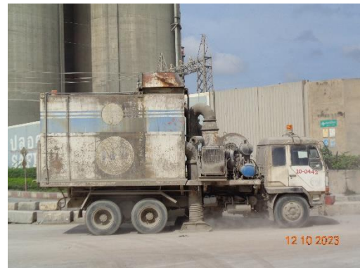
รูปที่ 2-32 รถดูดฝุ่นทำความสะอาดฝุ่น บริเวณพื้นที่โครงการ