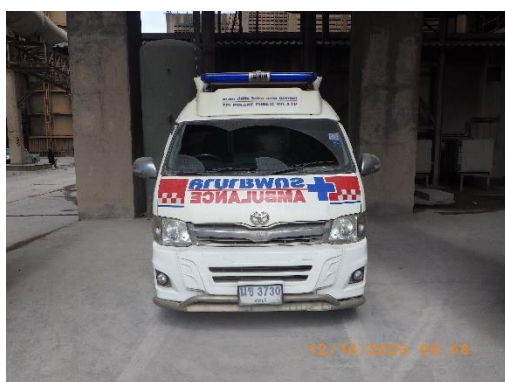
รูปที่ 2-15 ห้องพยาบาลและรถพยาบาลฉุกเฉิน