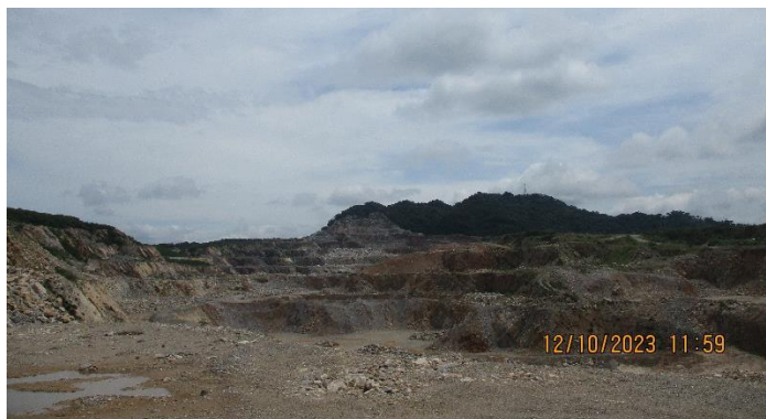
รูปที่ 2-1 สภาพหน้าเหมืองแร่หินปูน