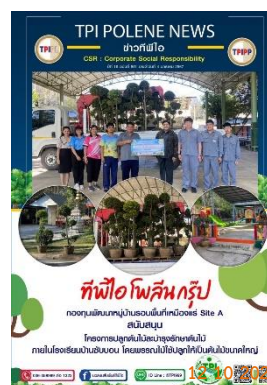
รูปที่ 2-44 สนับสนุนกิจกรรม ภายในโรงเรียนบ้านซบบอน